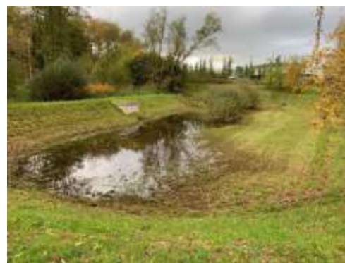
Parkplatz FOC Montabaur 5.000 m 2