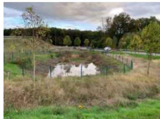
Autobahnzufahrt Meudt-Montabaur 4.000 m 2