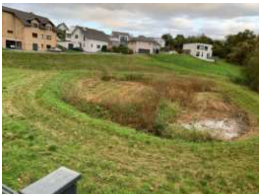
Wohngebiet hinter FOC ca. 25 Häuser 4.000 m 2