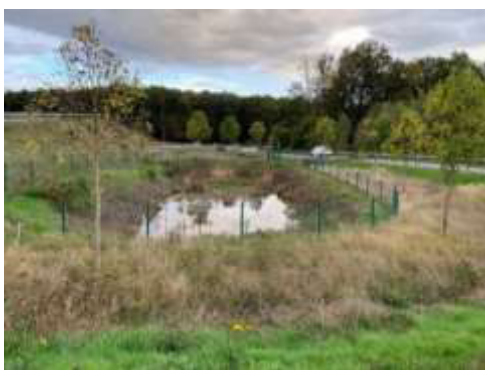
Autobahnzufahrt Meudt-Montabaur 4.000 m 2